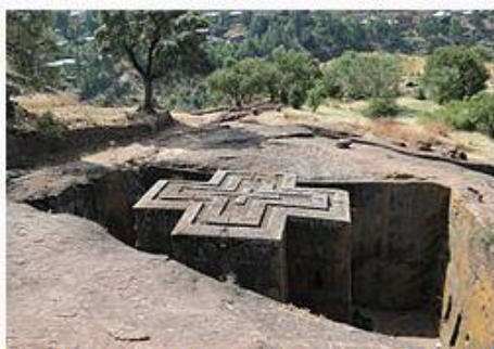
Kostel svatého Jiří , jedním z mnoha kostelů vytesán do skalnatých kopců Lalibela